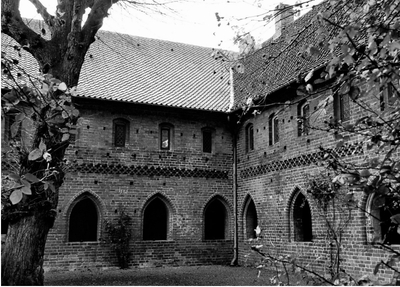
Fig. 1. Parti af den velbevarede klostergård og korsgang fra dominikanerklostret i Ribe. Den store mængde begravelser, der ofte findes i klostergårdene, er typisk blevet tolket som udefrakommende, der har købt sig til et gravsted i klostret.

været at foretrække. 7 Således holdt kong Christoffer af Bayern retterting i 1443 i Ribes franciskanerkloster. Kong Christian I holdt retterting i Københavns franciskanerkloster i 1475 og i Odense dominikanerkloster året efter, og hans efterfølger, sønnen kong Hans, holdt retterting i Odense dominikanerkloster i 1495, 1504 og 1508. I et brev fra 1504 fremgår det endda, at kong Hans havde ”sin Raadstue udi Sortebrødre Kloster i Odense”. 8 Det kongelige retterting var i grundstammen den højeste verdslige juridiske instans, hvor den kongelige magt blev udøvet, og som konsekvens af middelalderens rejsekongedømme var rettertinget sjældent stedfast. 9