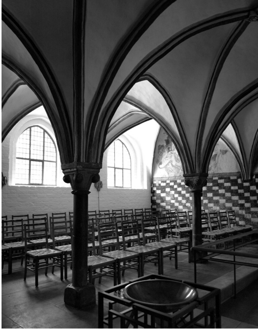
Fig. 4. Den bevarede middelalderlige sal i vestfløjen af dominikanerklostret i Århus. Med sin velvalgte placering i umiddelbar nærhed af det middelalderlige indgangsparti samt ekstravagante udsmykning med seks krydshvælv hvilende på to midtersøjler er det blevet anset for et velegnet rum til afholdelse af verdslige arrangementer og møder. I dag anvendes salen som kirke.

I det skriftlige kildemateriale findes sjældent præcise angivelser af, hvor begivenhederne fandt sted. Typisk ved vi blot, at det var ”i Sortebrødrekloster”, ”i Graabrødrekloster i den lille Stue” eller ”hos Dominikanerne”. Enkelte gange findes relativt eksakte angivelser, som det tidligere nævnte eksempel fra franciskanerklostret i Horsens, hvor refektoriet nævnes. Lidt overraskende er det også, at kong Erik af Pommern afholdt retterting ”i Otthense i Sakristiet i Sortebrødrekloster” i 1426. 34 Dominikanerne må her have haft et anseligt sakristi.